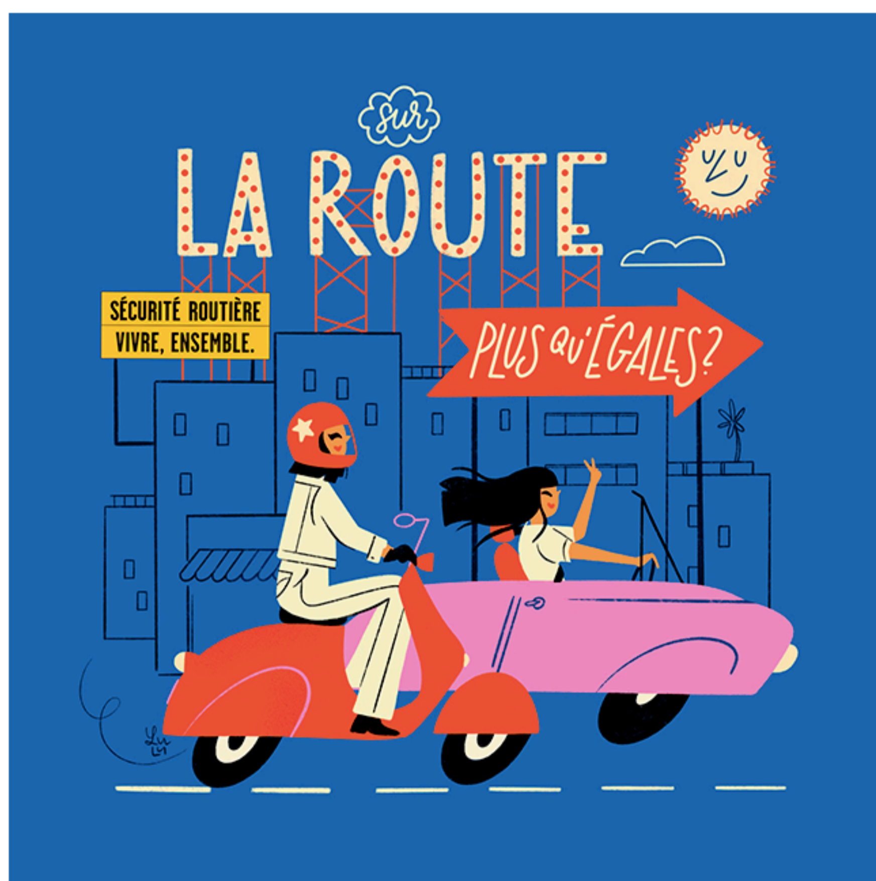
Illustration en pièce-jointe

À l'occasion de la Journée internationale des droits des femmes, la Sécurité routière rappelle que sur la route, les femmes n'égalent pas les hommes, elles sont supérieures ! Loin des célèbres clichés leur attribuant une conduite dangereuse, les chiffres démontrent, en effet, qu'elles causent moins d'accidents, meurent moins sur la route et contribuent ainsi à la rendre plus sûre. Une femme est tuée chaque jour dans un accident de la route dont un homme est responsable. En 2018, elles représentaient moins d'un quart des auteurs présumés d'accidents mortels sur la route, et seulement 17,8% des permis de conduire invalidés. Alors en cette journée qui est la leur, Messieurs, passez le volant !